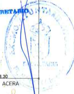
SECCION TIPO DE CALZADA Y ACERA CON TRATAMIENTO SUPERFICIAL ESC:1/20

DILIGENCIA: Para hacer constar que este documento ha sido aprobado DEFINITIVAMENTE por EL AYUNTAMIENTO PLENO, en sesión celebrada el día 9 DE DICIEMBRE DE 2009 El Ejido, a 30 de DICIEMBRE de 2009 DOY FE: EL SECRETARIO