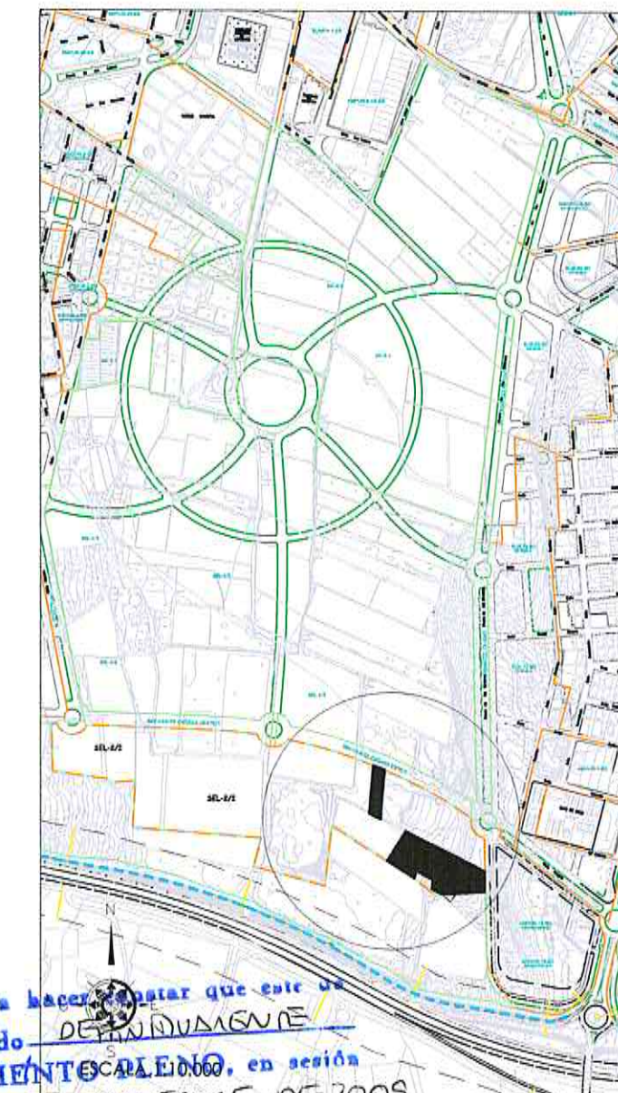
SISTEMA GENERAL INCLUIDO: SGV-2-BA/2 (TOTAL)

DILIGENCIA: Para hacer constar que este documento ha sido aprobado por el Ayuntamiento de El Ejido (Almería) en sesión plenaria de 10 de NOVIEMBRE de 2009. P.I. Pido. a 17 de NOVIEMBRE de 2009. S. G. ADSCRITO: SEL-2/I (SITUACION)