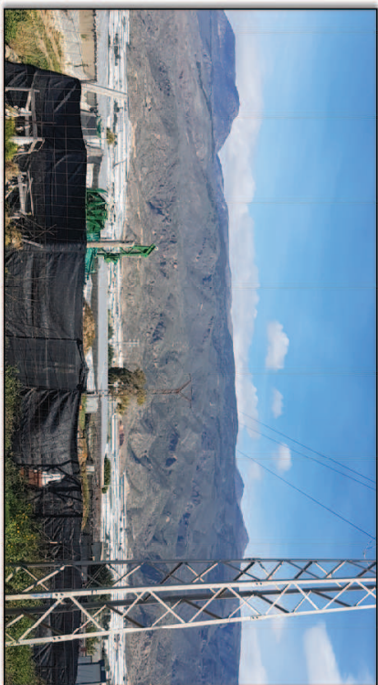
Fotografía 2. Vista parcial [fotográfica 2 de la situación del área establecida para la Innovación N°12 en los alrededores del Cementerio