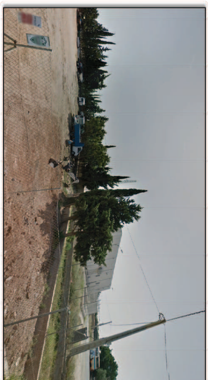
Fotografía 4. Vista [fotográfica de la situación del área establecida para la Innovación N°12. Emplazamiento Subestación de Ejido Norte

Independientemente de los factores ambientales y los posibles aspectos que se determinan, para establecer la viabilidad ambiental de la Innovación n°12 se ha considerado el cambio climático, pudiendo la incidencia medioambiental estar condicionada mínimamente por el Impacto Paisajístico, asociado a una gestión de residuos que pudiera ser manifestamente mejorable. Se han descrito una serie de medidas correctoras, que incluye proposiciones de corrección y seguimiento para estos factores; así como para el resto de los Impactos detectados sobre el aire, agua, tierra, Vegetación, etc.