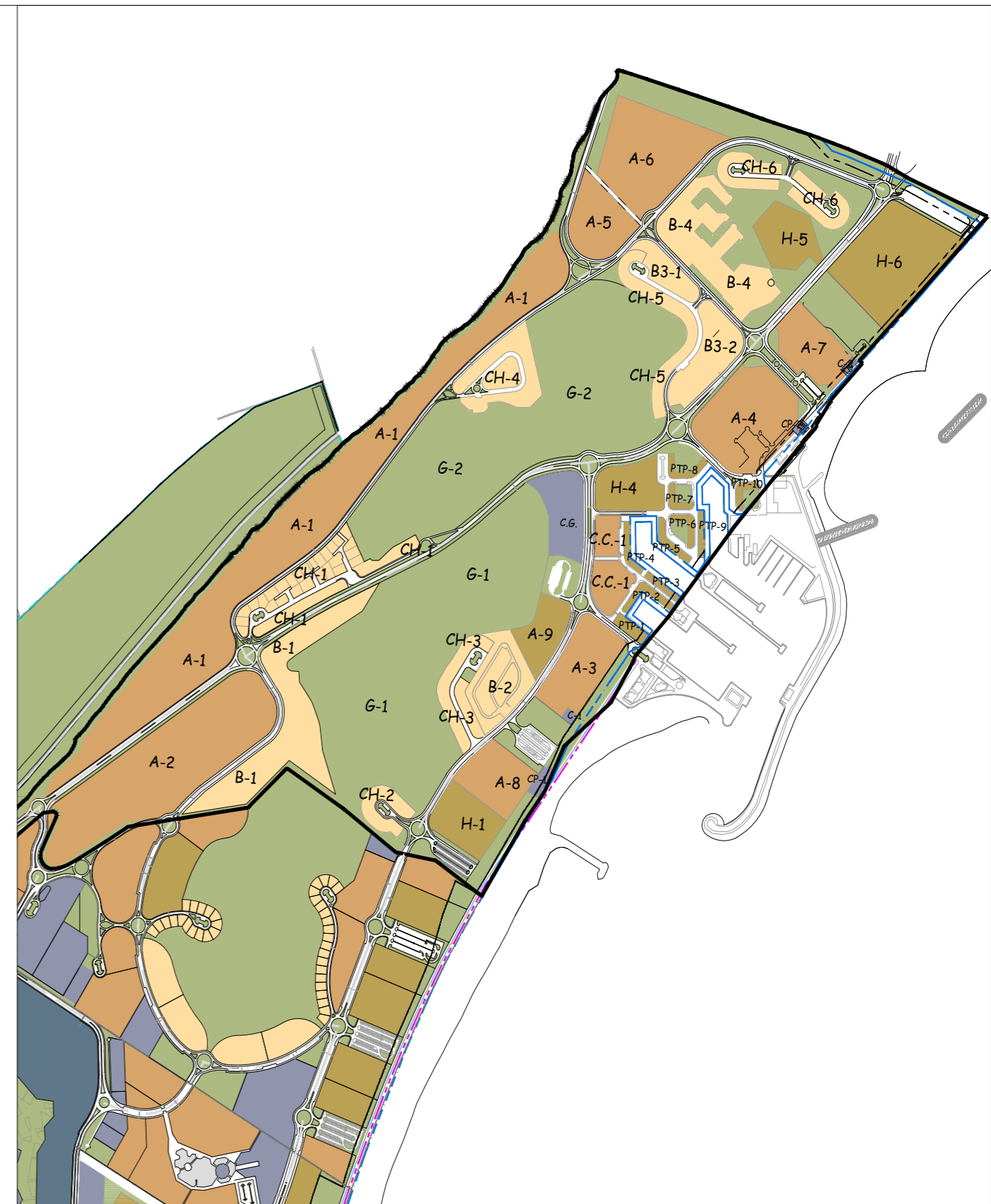
Se incluye a continuación la MODIFICACIÓN PLAN PARCIAL DE ORDENACIÓN ALMERIMAR I, PARCELA C.G.