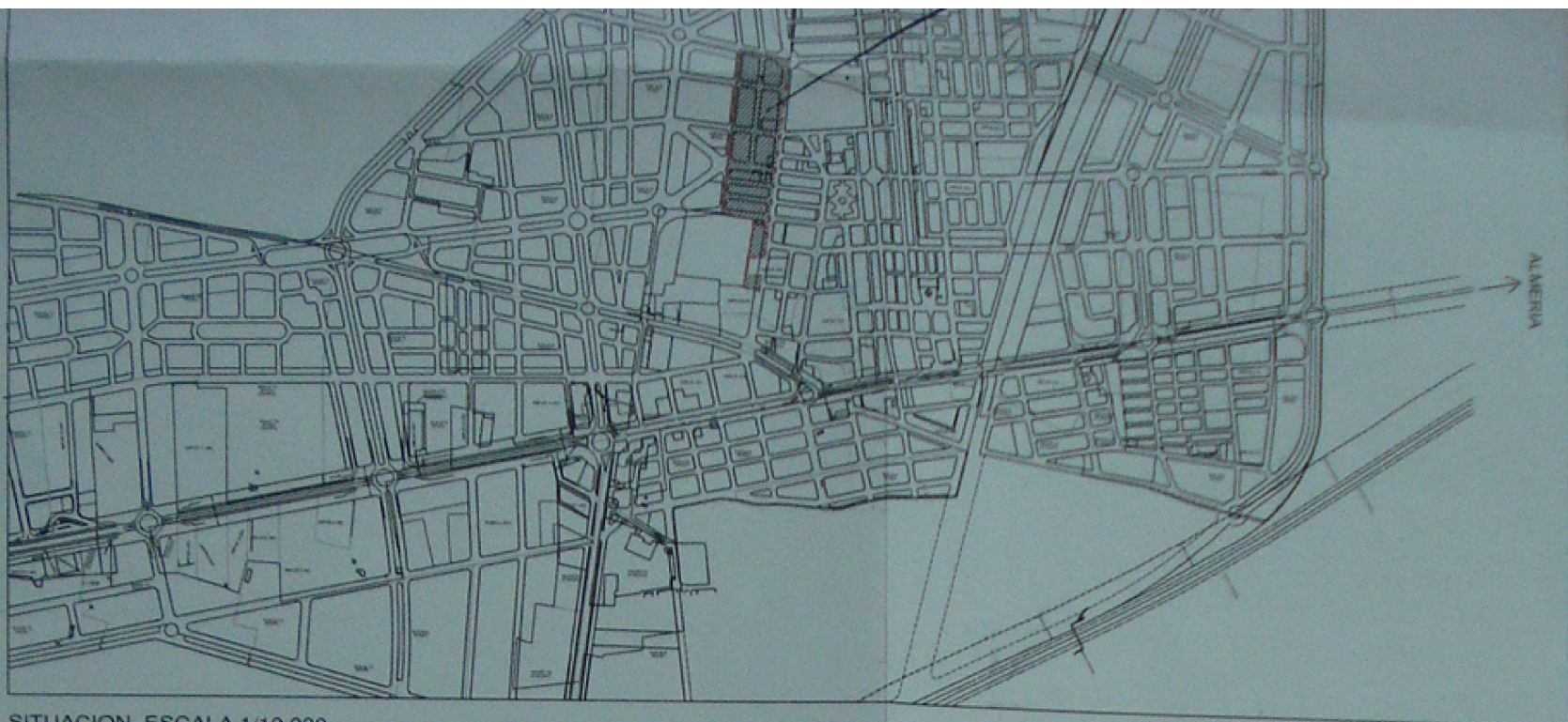
SITUACION. ESCALA 1/10.000