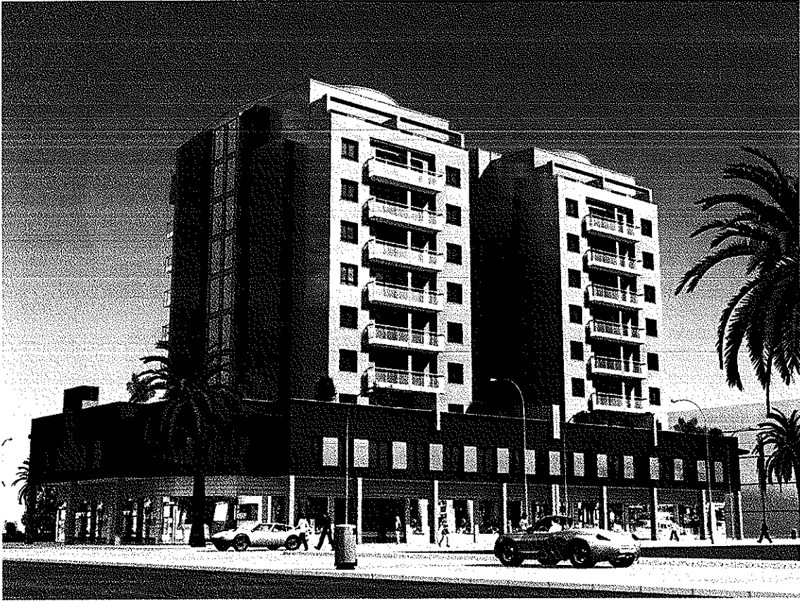
FACHADA C/ GENERAL GUTIÉRREZ MELLADO