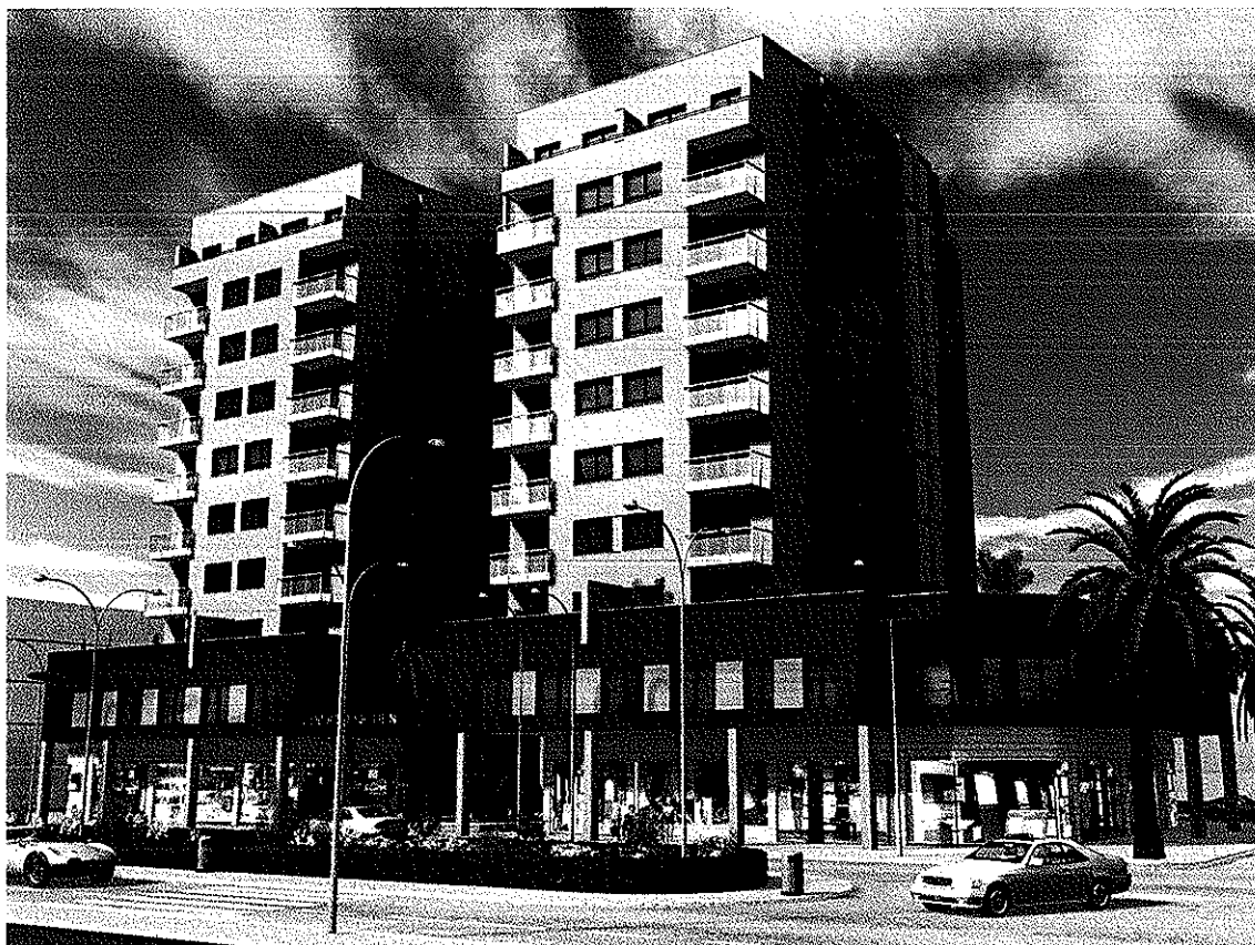
FACHADA AVDA. PEDRO PONCE