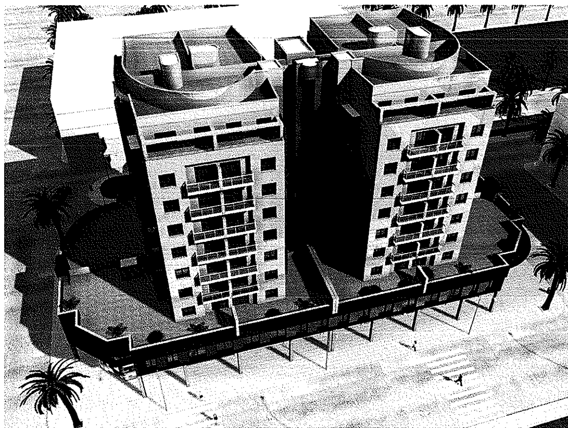
FACHADA C/ GENERAL GUTIÉRREZ MELLADO