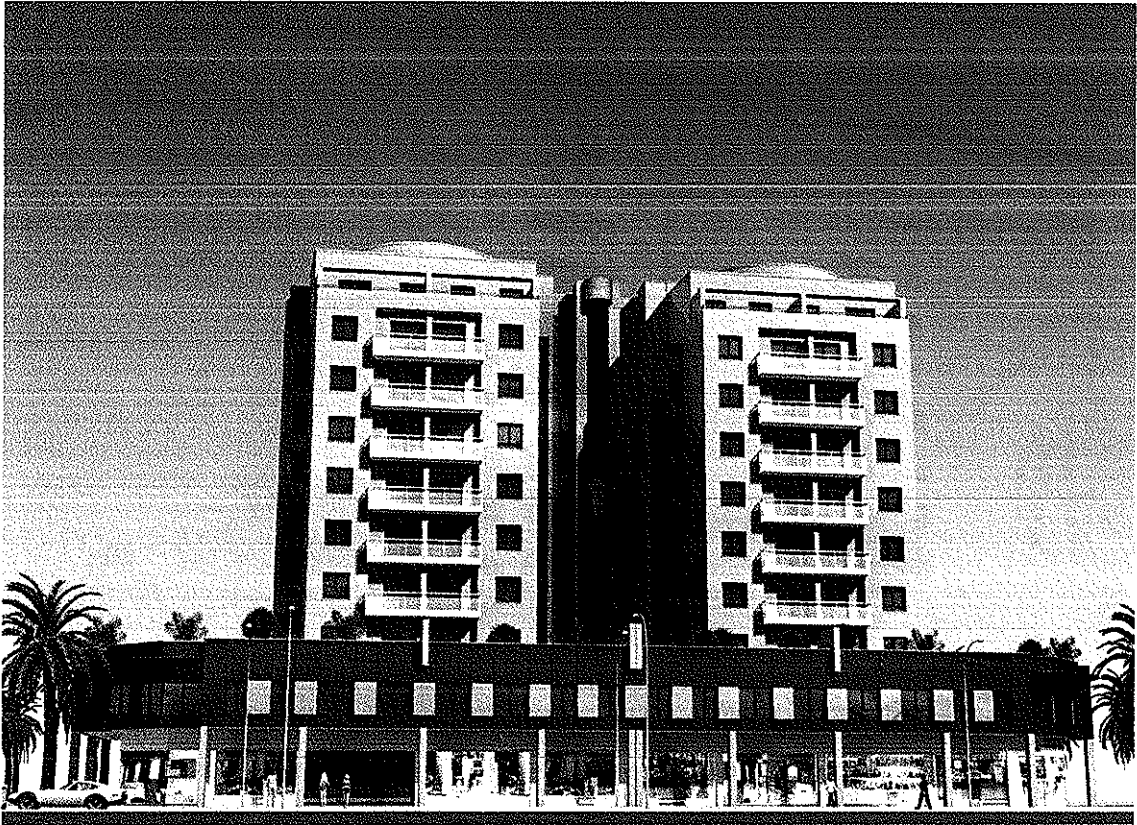
FACHADA C/ GENERAL GUTÉRREZ MELLADO