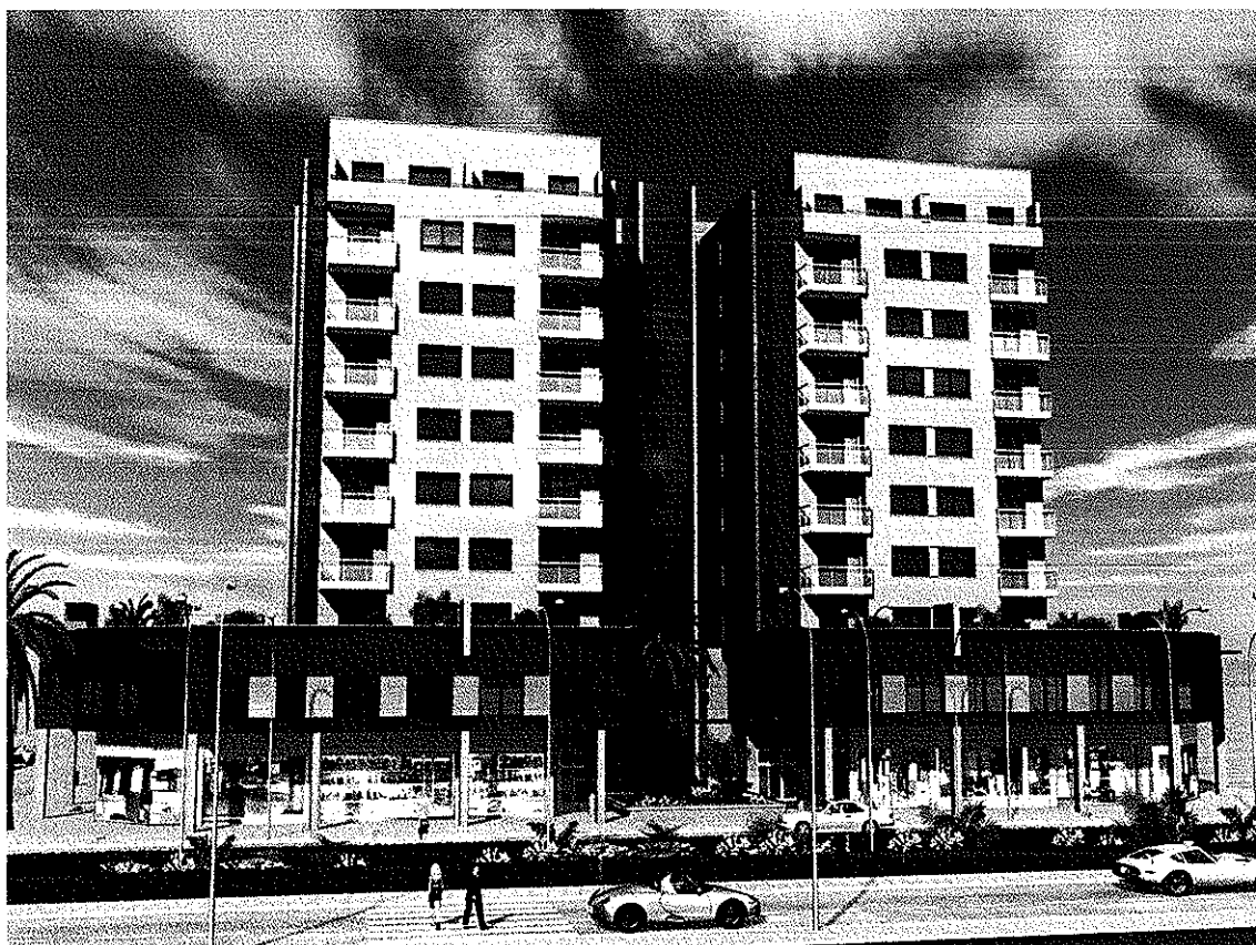
FACHADA AVDA. PEDRO PONCE